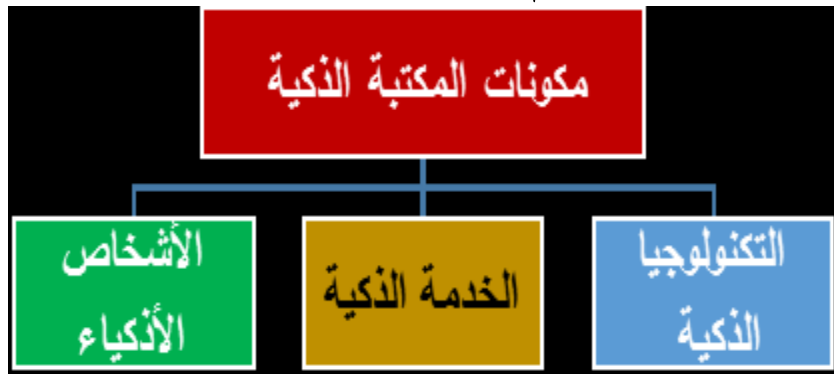
الشكل رقم 01: تمثيل لمكونات المكتبة الذكية

كذلك الخدمات الإعلامية كالإحاطة الجارية والبرث الانتقائي سيقدمها النظام بشكل تلقائي عبر البريد الإلكتروني أو الهاتف، بعد رسالة إشعار عن توفر ما قد طلبه المستفيد أو ما قد يكون ضمن اهتماماته. كما أن المكتبات لا تتعامل مع المسجلين فحسب بل حتى مع المستخدمين المحتملين وذلك من خلال التنسيق مع متعاملي شبكات الهاتف النقال بربث رسائل عامة للمجتمع الذي تخدمه ضمن نطاقها الجغرافي في إطار العلاقات العامة ومهمتها التسويقية 4 .