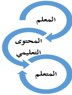
الشكل 2-عناصر العملية التعليمية

تتضمن العملية التعليمية مجموعة من العناصر والمهام التي تقوم فيما بينها علاقات تفاعلية، بحيث تشكل في النهاية نظامنا تربويا تعليميا متكامل اللبنة للوصول إلى تحقيق أهداف المنظومة التربوية التعليمية، وكذلك لتهيئة جيلا متعلما يساير ركب التطور العلمي والثقافي قادرا على خدمة مجتمعه، وطامحا إلى مستقبل زاهر مملوء بالإنجازات والنجاحات، لذلك تعدّ العملية التعليمية مجموعة من المواقف والأنشطة الصادرة عن المُدرِّس وعن التلاميذ، ولكنها ترتبط بكيفية منطقية منتظمة إلى الحد الذي يمكننا أن تنبأ بحدوثها في كثير من الأحيان، وترتكز في مجملها على عناصر أساسية أهمها العلم نفسه، والإنسانية في التعامل مع الطالب لإكسابه المهارات اللازمة التي تساهم في بناء شخصيته، ومعرفة تمكنه دخول معتزك الحياة، ومواجهة تقلباتها، وتتكون العملية التعليمية من عدة عناصر تعد أساسا لنجاحها وهي كالتالي :