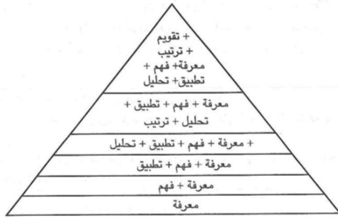
الشكل 1- التسلسل الهرمي للعملية التعليمية

يقول ابن عاشور: «وقد انقسمت العلوم إلى عملية ونظرية (...) فيجب أن نطلب في العلم العملي؛ مبلغ عمل التلميذ به، وفي النظري؛ مبلغ فهمه فيه» 1 ، فالتعليم يحتاج إلى (المعرفة أو محتوى تعليمي) التي تُساق وفق ما يتناسب مع عقول المتلقين، وبالتالي نصل إلى مستوى (الفهم) والذي يخص الجانب النظري - كما أحال إليه ابن عاشور- والذي يتدرج فيه المتعلم ليصل إلى الدراية الفنية والتي تسمى (المهارات)، ومن خلال المهارة يمكن للمتعلم تطبيق المعرفة التي تلقى تفاصيلها، وهذا يخص الجانب العملي - كما أحال إليه ابن عاشور - ومع ممارسة التطبيق يمكن للمتعلم أن يحلل المعلومة أو المعرفة، ثم إن التركيز على مهارات التعامل مع الآخرين (المواقف) يمنح المتعلم القدرة على ترتيب المواقف والحالات، وفق تسلسل تصاعدي كلما تقدم في المعرفة أكثر، أو تدرج في مستويات العلم أكثر، ليصل إلى أعلى قمة في التسلسل الهرمي، والتي يجمع فيها بين المعرفة وفهمها وتطبيقها وتحليلها وترتيب تفاصيلها وتقويمها، وفق ما تحصل عليه من مخزون معرفي علمي، عبر مراحل تدرجه.