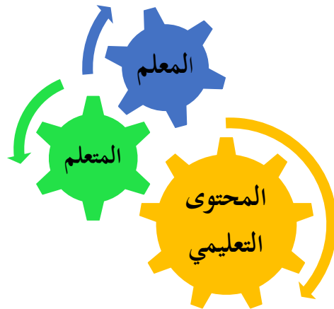
الشكل 4- مسار العملية التعليمية

وحجة ابن عاشور، في التركيز على التأليف أو الكتاب المدرسي أو المحتوى التعليمي، هي أنّ المعلم «مهما بلغ به الجمود لا يمكنه أن يحول بين الأفهام وما في التأليف، ونحن نفتتح من اصلاح العقول الغضة بأن تظنّ على اسماعها الآراء الصائبة والعلوم المحققة، ولا نخشى في خلال ذلك من صرف أذهانهم عنها بصرف صارف، فإنّ لنور الحق سلطاناً» 2 وإن لمقاصد القرآن قصصاً وبلاغة وبيانا، تنعش الفهم بالعبارة، وتحلي اللسان بالبيان، وتزيد المروءة بالقدرة على تدبيح اللغة وتطويعها بالنحو البلاغة، ولتزيد العقل اتزاناً ورجحاناً بالحكمة والمنطق، والقرآن الكريم دستور جامع لكل روافد العلوم فلا حصر لعلم دون آخر ولا مفاضلة لرافد عن غيره، وما المعرفة إلا جزء ضئيل من هذا الدستور الجامع.