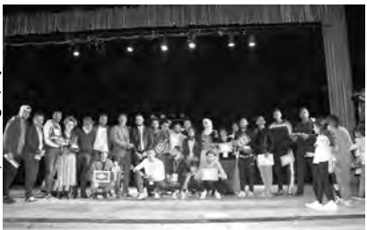
جانبا من الاختتام