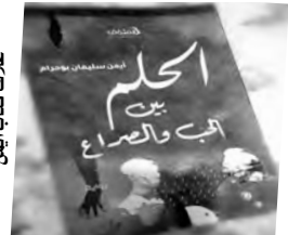
غلاف كتاب أيمن

وسانده التامة لكل من حمل قلمًا وحارب لأجل تحقيق حلمه. وأضاف: لكن هناك من يكتب لأجل إحباط معنويات الآخرين من خلال كتابته نقدًا غير بناء، لهذا على الكاتب أن يتحلى بروح صبور، ويتجنب الاحتكاك غير الضروري، كما أن كل فكرة لها معنى ومبدأ وهدف تستحق النشر.