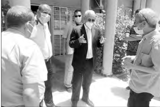
عملية جراحية بمستشفى زربية الوادي، 204 فحص طبي، منها 20 حالة خاصة، تم تحويلها إلى العاصمة